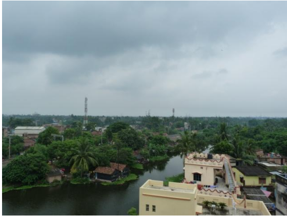
Blick vom Dach des Asha Kiran Hostels