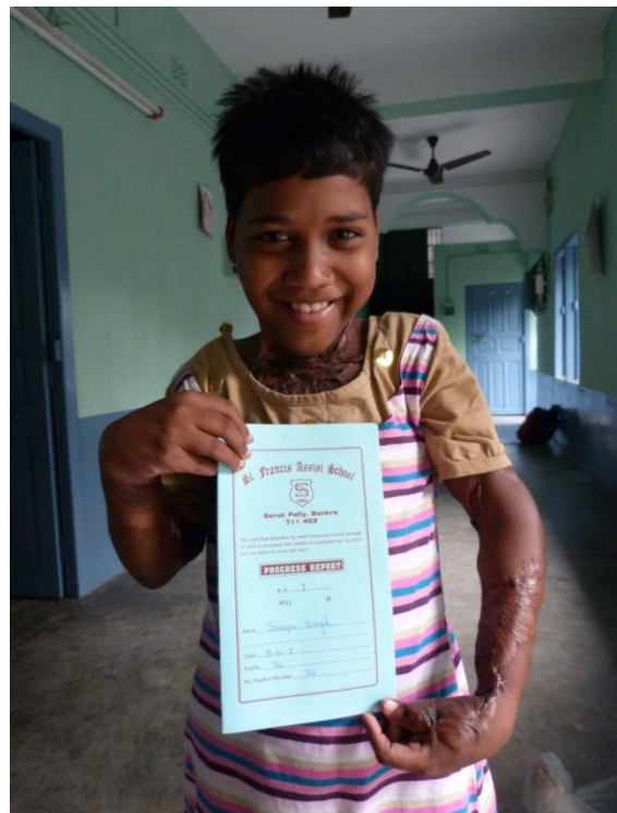
Sampa freut sich über ihr tolles Zeugnis