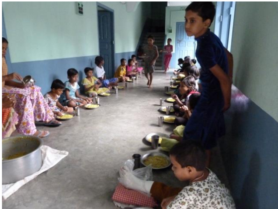
Mittagessen im Asha Kiran ...