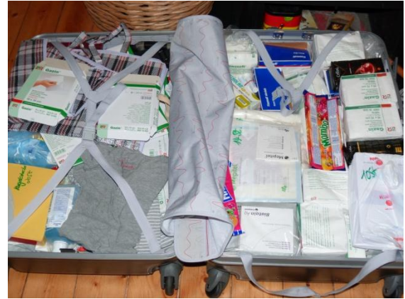
Material für das Interplast Camp Januar 2012

Ich hoffe wirklich sehr, dass ich eine gute Lösung und Unterbringung für Sampa finden werde.