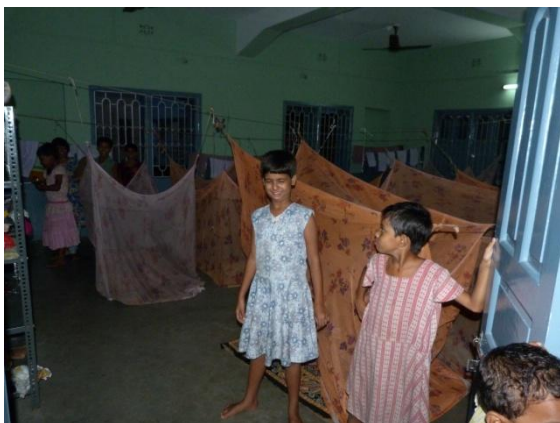
Hier schlafen die Mädchen, alle sicher unter einem Moskitonetz